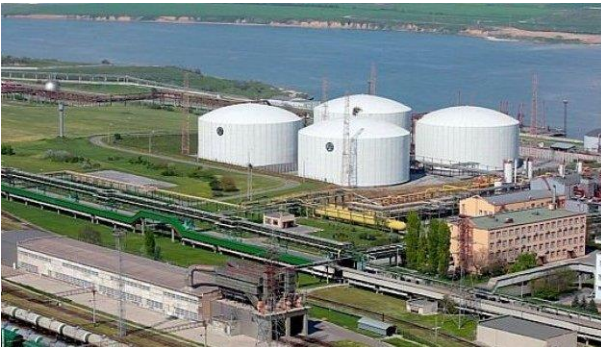
Схема розтрати коштів Укрхімтрансміаку спричинила мільйонні збитки - МВС

Експозаводцю комунального підприємства «Київводфонд» повідомили про підозру у розтраті близько 500 тис. грн.